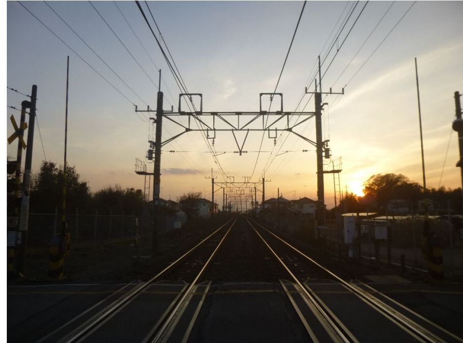
学校通り踏切から東北本線栗橋方面を望む