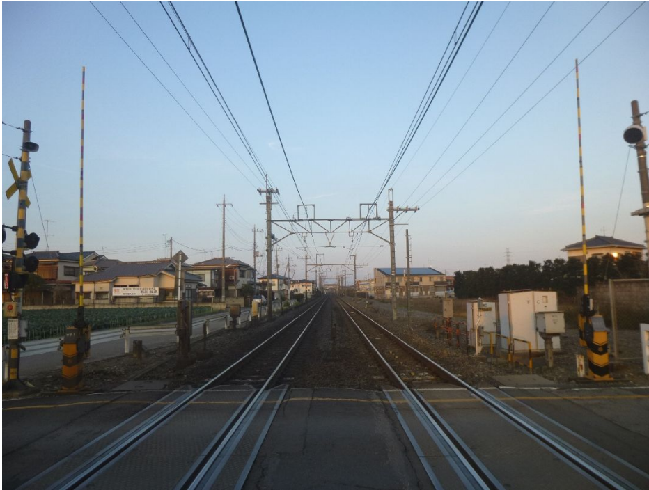
学校通り踏切から東北本線古河方面を望む