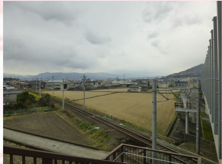
上野鶴吉跨線橋より北東方向を望む