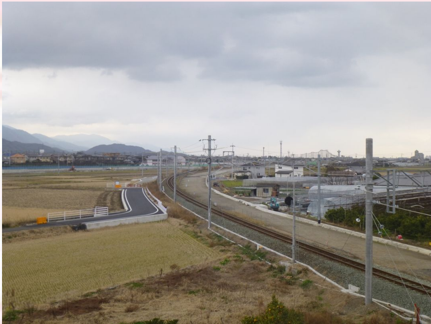
上野鶴吉跨線橋より南西方向を望む カーブ内側は車両基地・貨物駅(建設中)