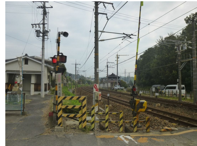
第5明治街道踏切から 中央西線土岐市方向を望む