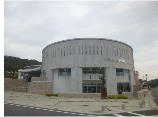
どうしん学びの丘“エール” 講義棟・研修棟・どうしん美濃陶芸美術館