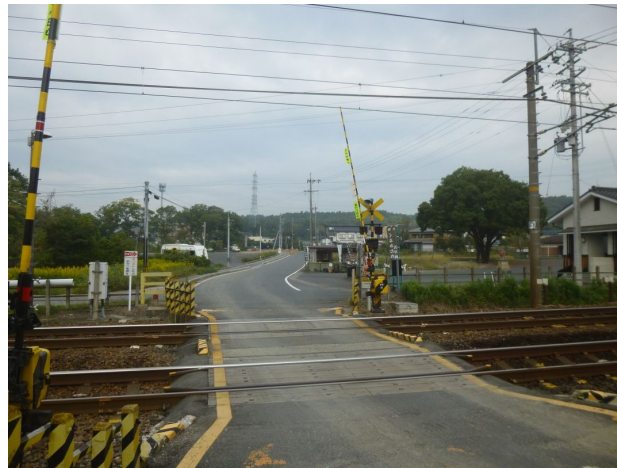
第5明治街道踏切から 虎溪山バス停方向を望む