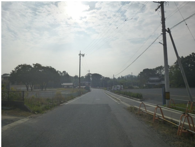
虎溪山バス停付近から 第5明治街道踏切方向を望む