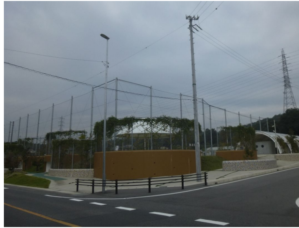
どうしん学びの丘“エール” 芝生広場