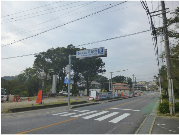
虎溪山バス停と 永保寺入口を示す石碑・看板