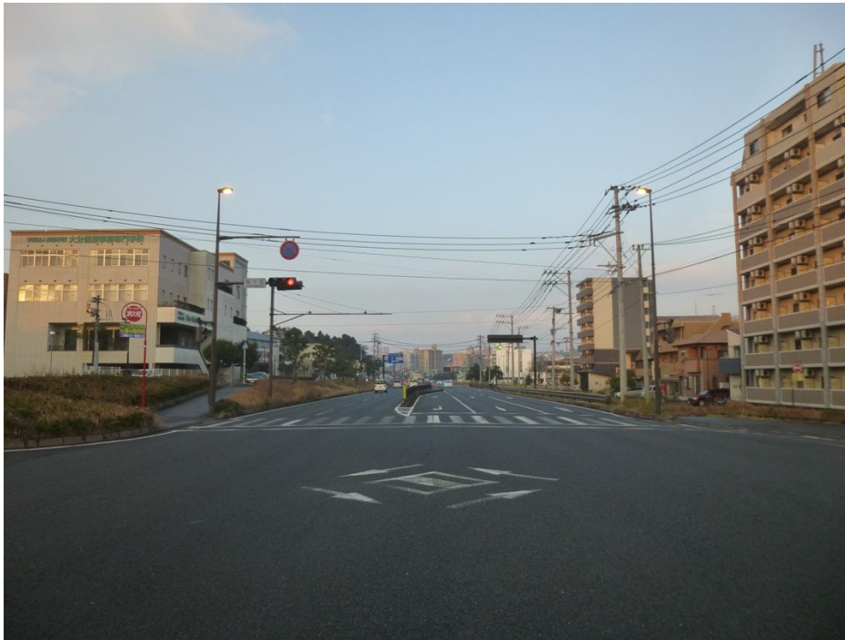
庄の原佐野線桜ヶ丘交差点より東方向を望む