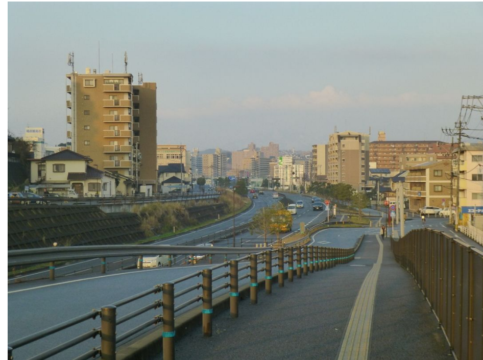
桜ヶ丘交差点遠景

※ 私案でありここよりも適切な場所が確保できるのであればこの限りではありません。